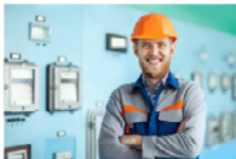
Vi skaper kundeverti