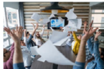
Vi er entusiastiske