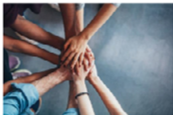
Vi blir bedre sammen

Vår bedriftskultur og vårt verdigrunnlag sammenfattes i fire punkter som underbygger vår visjon og bidrar til vår fremgang og vilje til å utgjøre en forskjell: